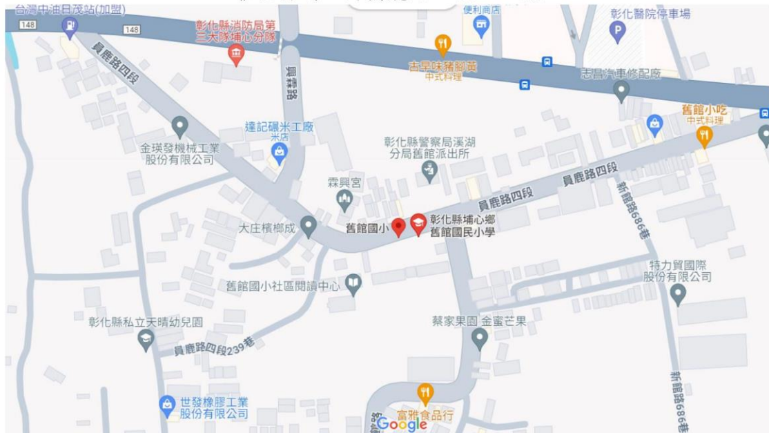
(舊館國小 google 地圖)