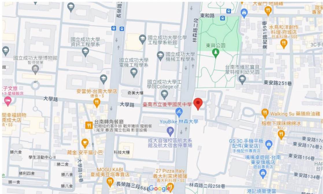
(後甲國中 google 地圖)