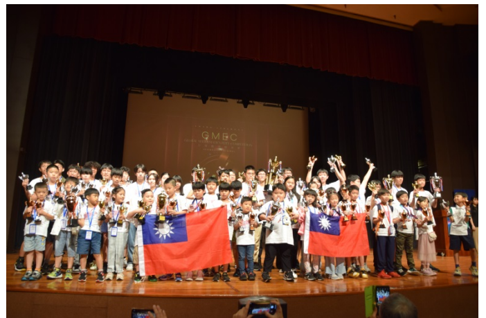
※2024 年 台灣代表隊