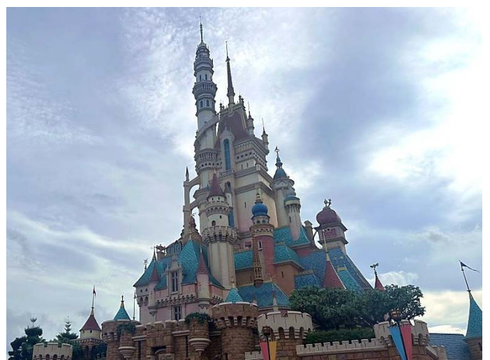
※2024 年 前進香港迪士尼