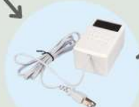
智慧開關/ 節能監測