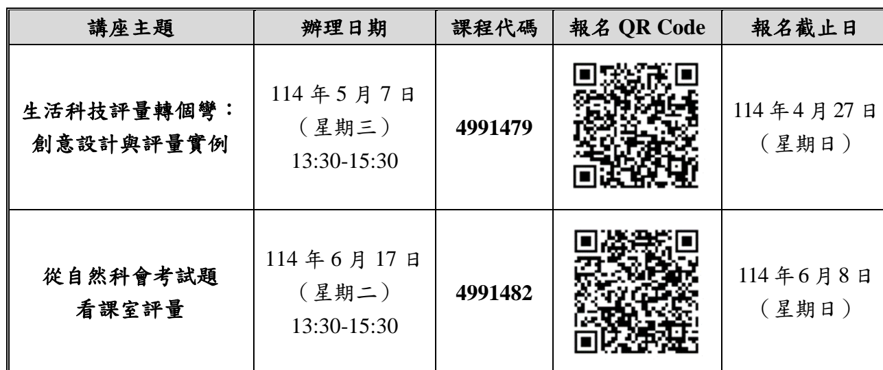
表 2 專題講座報名資訊