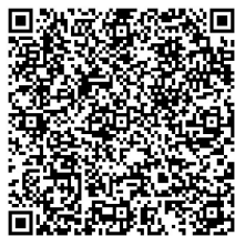
62 團賽報名表格下載