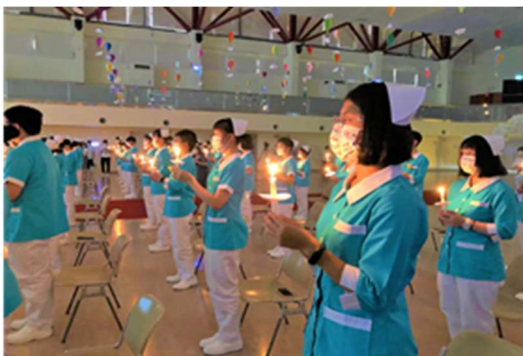
護理傳承與承諾：加冠典禮