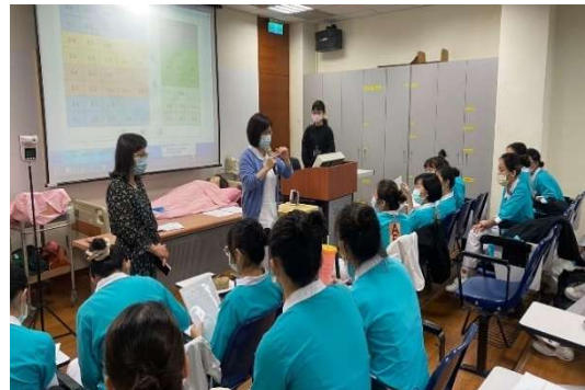
護理強化與專業：課程教學